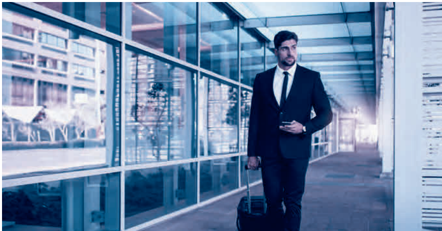
A1-Bescheinigung dabei? Sie ist für alle Aktivitäten im Ausland nötig.

entrichten hat. Es ist für sämtliche grenzüberschreitenden Tätigkeiten nötig, beispielsweise für Berater, Künstler, Journalisten oder Mitarbeiter im Transport oder Baugewerbe, und zwar auch dann, wenn der Aufenthalt nur wenige Stunden beträgt. Ausgestellt wird die A1-Bescheinigung von der AHV-Ausgleichskasse im Wohnsitzland des betroffenen Arbeitnehmers, beantragt wird sie vom Arbeitgeber des Entsandten bzw. direkt vom Selbständigerwerbenden.